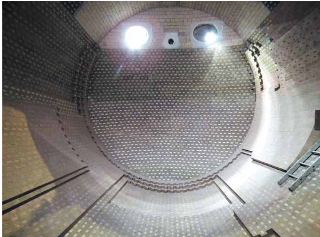
A nyersvaskeverő berendezés elkészült tűzálló falazata

ni a távolságtartásra is, ahol lehetséges volt. Hazaérkezésünk után az egész építő csapat két hétre karanténba kerül, a cég biztosít egy elzárt területet erre a célra.