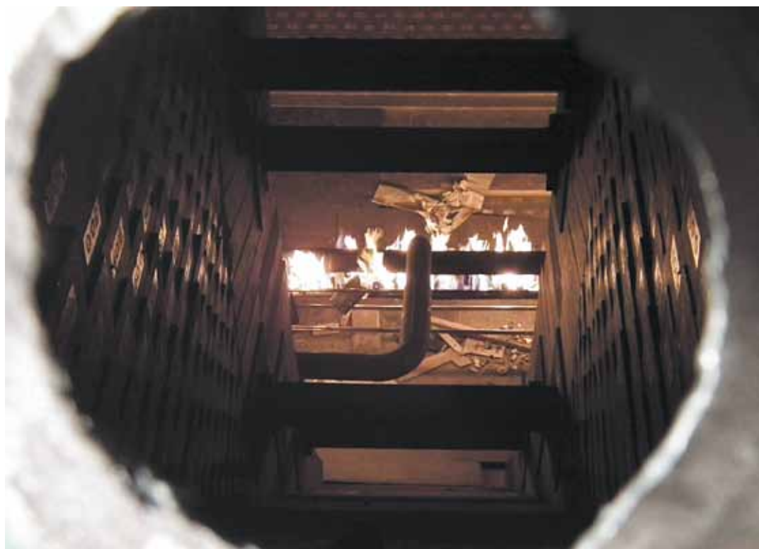
Ez látszik a „kémlelőnyílásban”: a begyújtás pillanata a felfűtés kezdetén

– Az ideai átépítés befejeztével április 3-án, 10 óra 45 percor került sor a nyersvaskeverő felfűtésének kezdetét jelző égőbegyújtásra. Ezt megelőzően átellenőriztük a teljes gázrendszert. A felfűtés első szakasza ezúttal a keverőtest kiszáritását jelenti, mert a korábbi átépítésektől eltérően nem ennek végén, hanem csak egy későbbi időpontban kerül majd sor az első nyersvasbeöntésre.