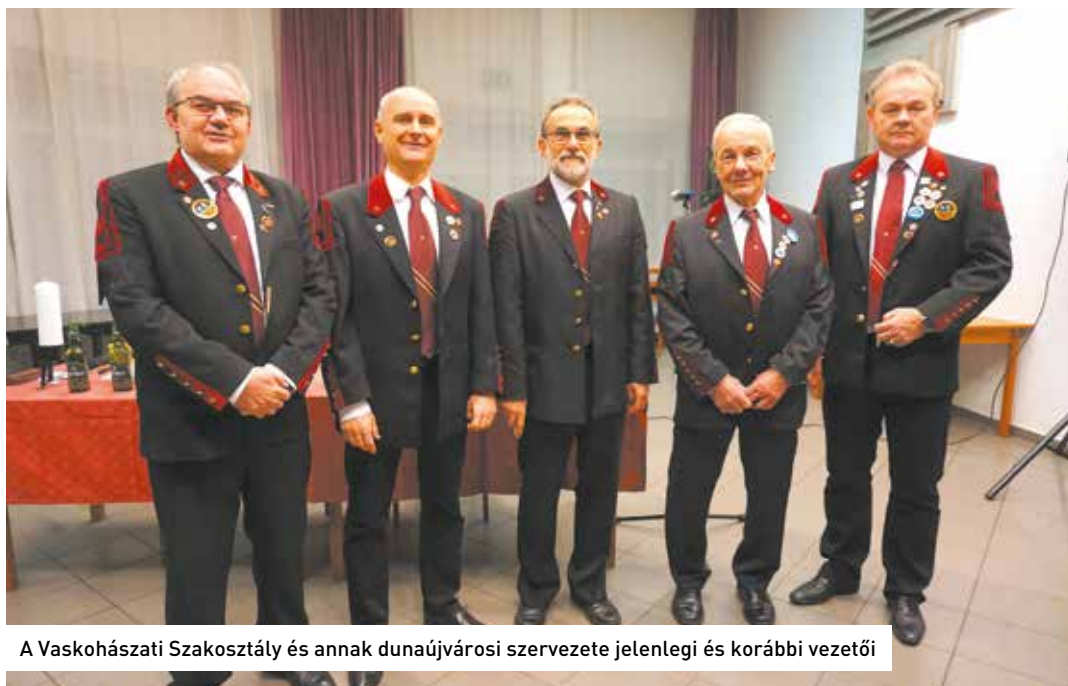
A Vaskohászati Szakosztály és annak dunaújvárosi szervezete jelenlegi és korábbi vezetői

Kormányzati kezdeményezésre kompetenciaközpontok fogják támogatni a paksi új atomerőművi blokkok létesítését. Az egyik ilyen bázist a Dunaújvárosi Egyetemen alakítják ki.