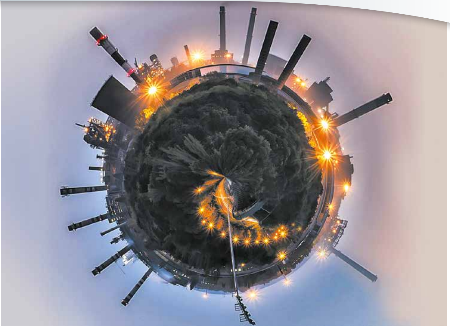
Fotógráfika: Németh Zsolt